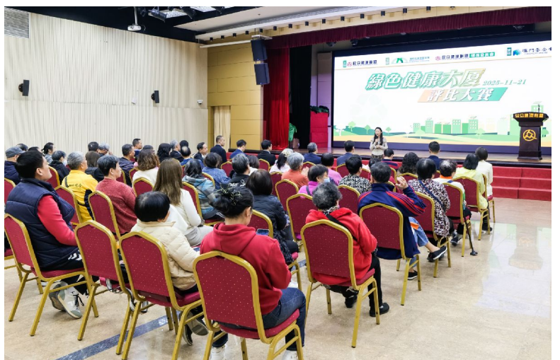
獲獎大廈管理機關代表分享節能心得

打造綠色城市可從節能和減碳措施著手，並要透過宣傳教育及推廣，普及居民對低碳發展的新理念和新知識，推動全社會實踐綠色出行、資源回收、減廢惜食、節能減排等低碳消費和生活模式。澳門基金會每年推出資助計劃，支持本地社團配合特區施政方針策劃多元化