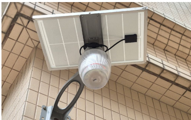
參賽大廈平台花園增設太陽能照明燈