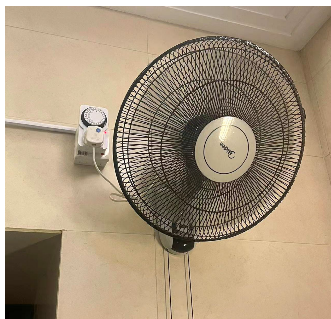
參賽大廈於風扇開關加裝定時系統