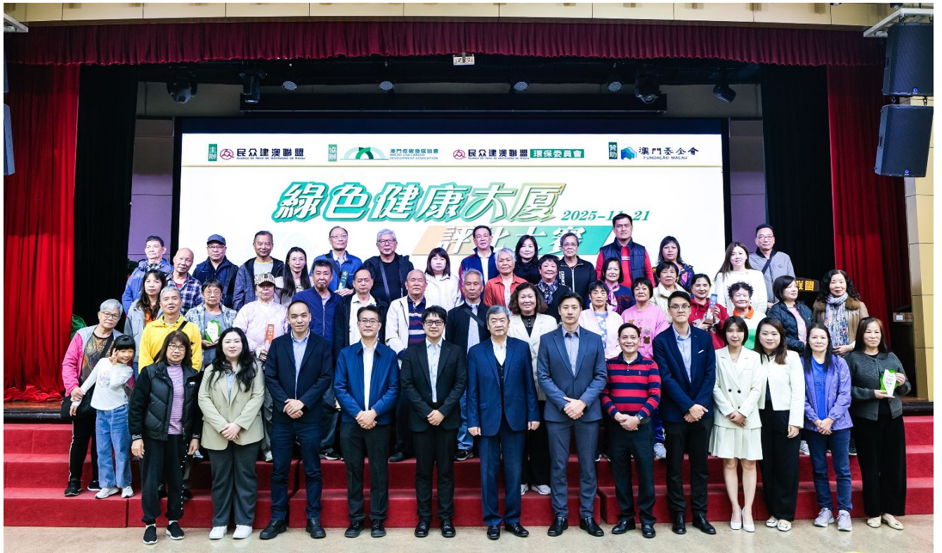
澳門基金會資助社團舉辦“綠色健康大廈評比大賽”，倡導使用環保節能設備及優化大廈環境治理。