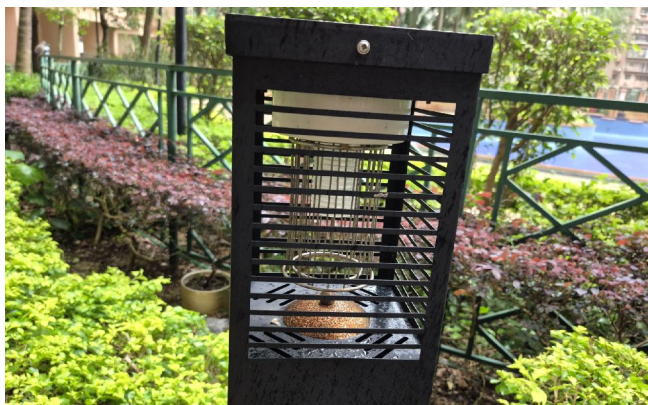
參賽大廈增設太陽能滅蚊燈