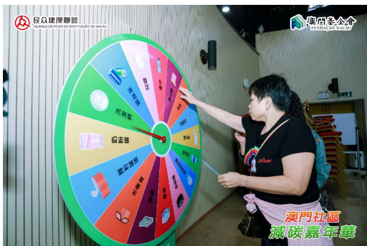
互動遊戲助參加者進一步應用分類回收知識